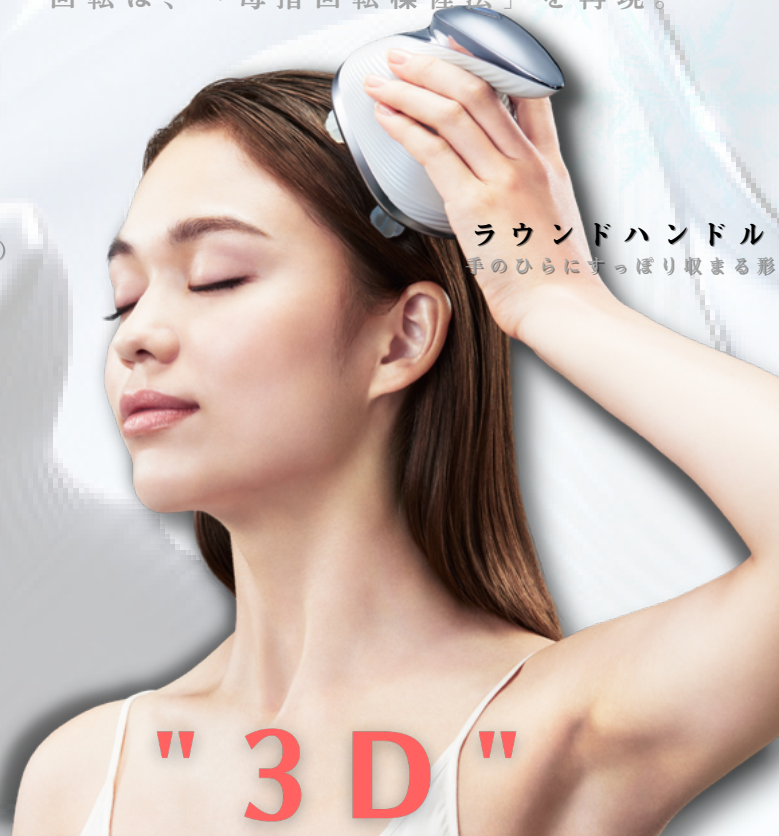
ラウンドハンドル 手のひらにすっぽり収まる形